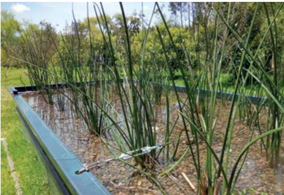
Experiencia en tecnología alternativa para el tratamiento de las aguas residuales en instalaciones ETAPA-EP en Cuenca, Ecuador.

El éxito de esta iniciativa también va de la mano del compromiso sincero de las partes involucradas que deben ser capaces de identificar beneficios en diferentes ámbitos, así como responsabilidades y deberes, con miras a fortalecer las oportunidades de cooperación en el mediano y largo plazo.