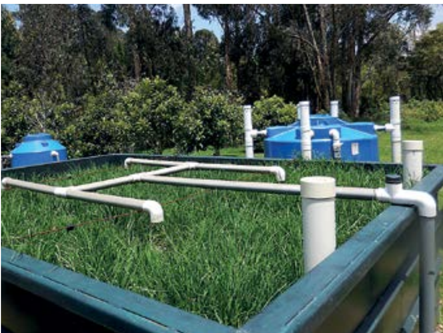
Instalaciones de la Empresa de Telecomunicaciones, Agua Potable, Alcantarillado y Saneamiento de Cuenca (ETAPA-EP), Ecuador.

avanzar con la firma del convenio marco interinstitucional de cooperación establecido como uno de los puntos acordados en el Acta de Compromiso de Trabajo. Está pendiente consolidar una agenda de trabajo conjunto en los temas de interés identificados. De manera paralela, se han establecido relaciones de cooperación importantes entre las partes involucradas que fortalecen el proceso de hermanamiento. Por ejemplo, está en curso un proceso de cooperación entre las universidades del Azuay, USFX y Cusco para el desarrollo de una